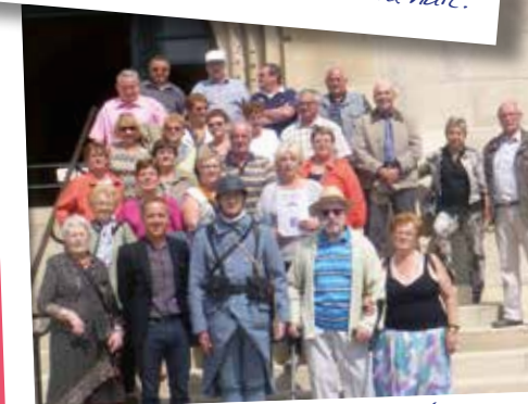
19 juin Voyage des aînés à Verdun: émotion et bonne humeur chez les 34 participants