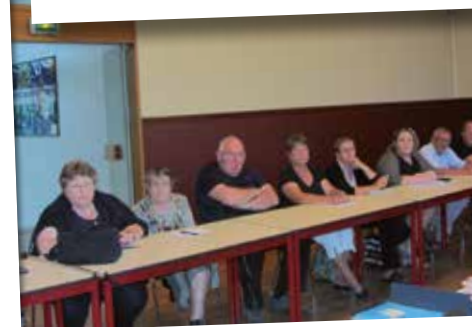
23 juin La municipalité, aux côtés des associations, pour parler « Brocante »