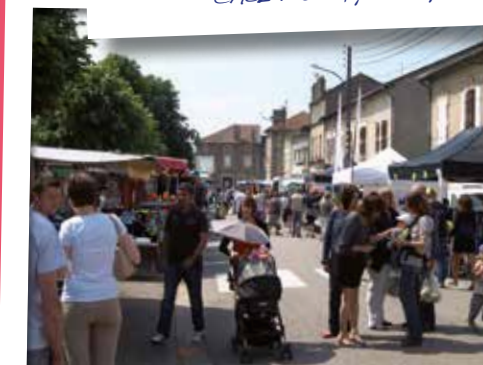
1 er juin Un moment de flânerie, de rencontres et... de gourmandise à la 4 e Foire du pâté lorrain