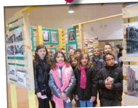
Du 10 au 14 mai: Plus d'un millier de visiteurs à l'exposition initiée par le Collectif « 14 Mémoire Vive », « La Vie quotidienne d'avant »