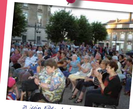
21 juin Fête de la Musique. Un programme varié qui a ravi toutes les générations jusque tard dans la nuit.